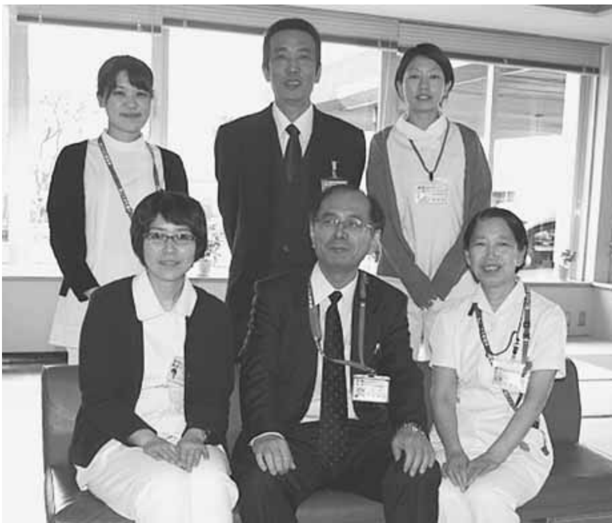
写真：認知症疾患医療センタースタッフ（前列中央は宮永院長）