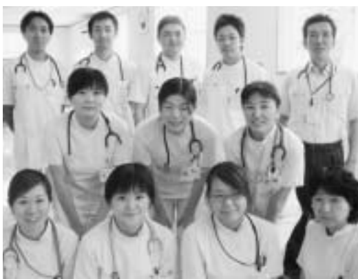
リハビリスタッフです