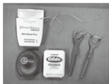
図2 デンタルフロスと糸付きようじ