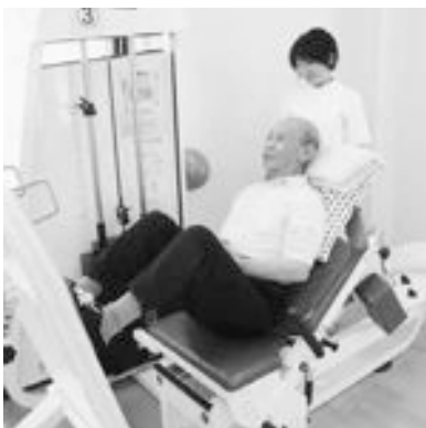
「リズムに合わせてイチッ・ニッ」