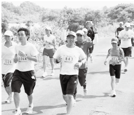
猛暑の中、行われたグルメマラソン（6月12日）

数やレース棄権者数が多くなるといわれています。日本においては緯度によって異なりますが、季節的には10月から4月までがマラソンに適している環境といえ、5月と9月は要注意で、真夏の大会などはたとえ早朝であっても行うべきではありません。 先日当地でグルメ・マラソンと称し、昼食後2時スタートのハーフマラソンが