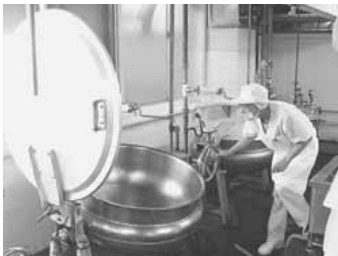
大きな回転釜 使用後はピカピカに