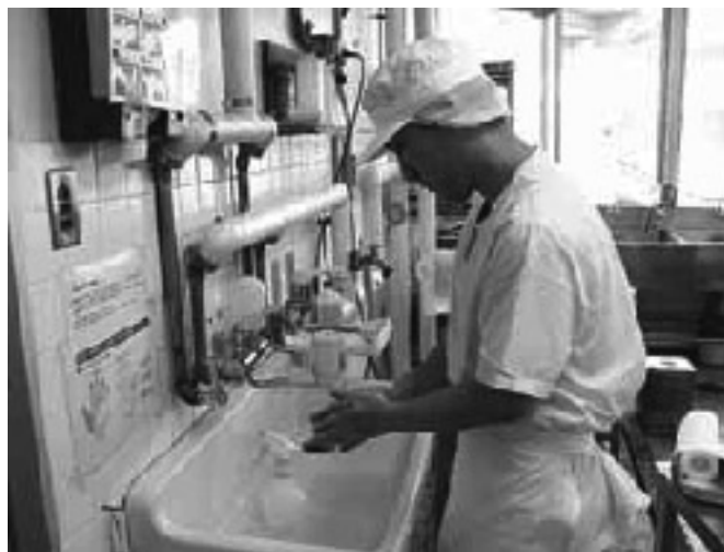
作業開始前、まずは手洗いをしっかりと