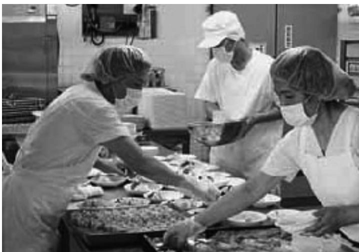
ていねいに盛り付けをします