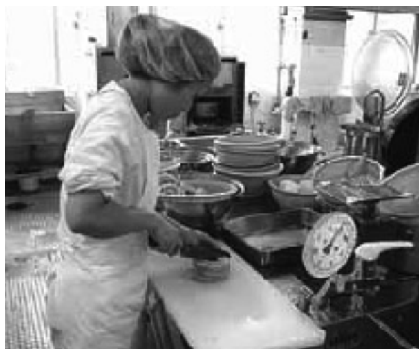
材料の仕込みをしています

南魚沼市立ゆきぐに大和病院 【ホームページ】 http://www.city.minamiuonuma.niigata.jp 【E-mail】 niigata@yukigunihp.jp ※南魚沼市のホームページが表示されますので、健康・福祉>市立病院など と進んでください。 南魚沼市立城内病院 【ホームページ】 http://www17.ocn.ne.jp/~jounaihp/ 【E-mail】 jounai@city.minamiuonuma.lg.jp