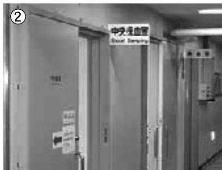
② 検査室手前が中央採血室です。