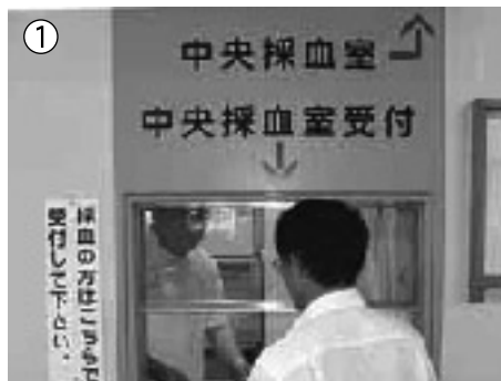
① 予約券を受付にお出してください。