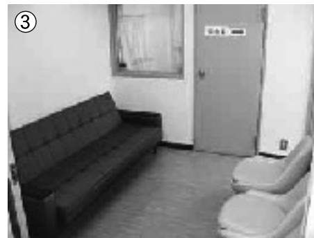
③ 待合室でお待ちください。