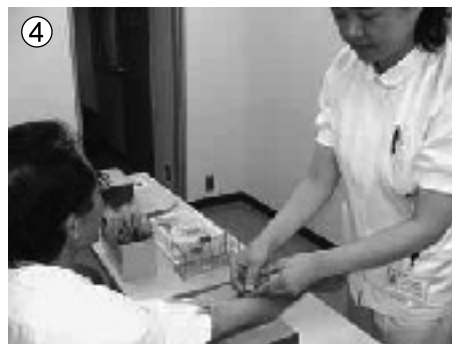
④ 採血を行います。 採血後は予約の科でお待ち下さい。