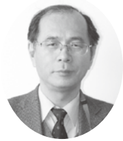
南魚沼市 病院事業管理者 ゆきぐに大和病院